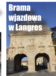
Brama wjazdowa w Langres