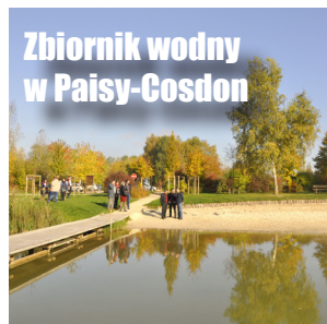
Zbiornik wodny w Paisy-Cosdon