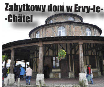
Zabytkowy dom w Ervy-le-Châtel