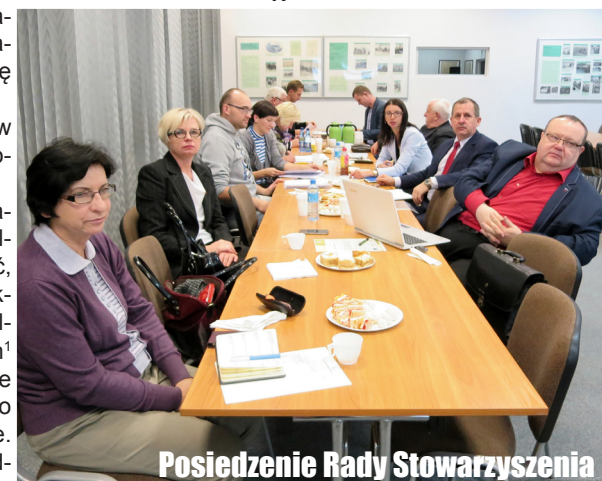
Posiedzenie Rady Stowarzyszenia

Z kolei racjonalne oznacza dokonanie zakupu po najniższej cenie ale przy danych parametrach - optymalnie. Przed określeniem wysokości kosztów powinniśmy zastanowić się jakie parametry, specyfikacja czy inne kryteria danej maszyny, usługi czy sprzętu są niezbędne do prowadzenia, bądź rozwinięcia działalności. Jeśli potrzebujemy sprzętu, maszyn bądź usługi o podwyższonym standardzie należy uzasadnić dlaczego specyfika naszej działalności wymaga takiego sprzętu/usługi a nie innej. Do kosztów kwalifikowalnych nie zaliczamy kosztów bieżących np. towarów przeznaczonych do dalszej sprzedaży oraz zakupu maszyn i urządzeń używanych. Wniosek oraz biznesplan powinny być ze sobą spójne. Dlatego też należy sprawdzić czy wszystkie informacje zapisane w części wniosku dot. uzasadnienia zgodności z celami i kryteriami wyboru operacji są zgodne z pozostałymi danymi zawartymi we wniosku np. liczba utworzonych miejsc pracy, data rozpoczęcia działalności, wnioskowana kwota pomocy czy uzasadnienie kosztów. Wszystkie te informacje są weryfikowane przez Urząd Marszałkowski, w przypadku rozbieżności wnioskodawca może zostać poproszony o złożenie wyjaśnień.