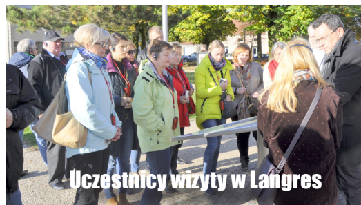
Uczestnicy wizyty w Langres