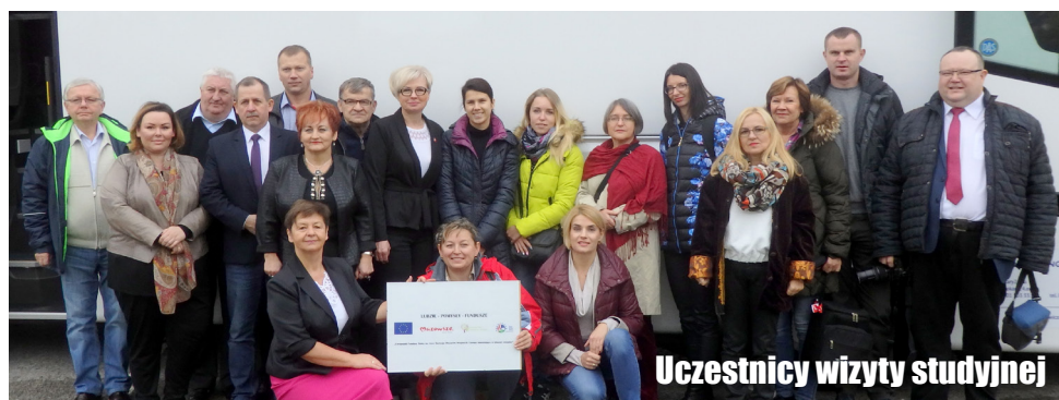
Uczestnicy wizyty studyjnej

Informacje pozyskane w ramach projektu Innowacyjna Szampania dofinansowanego w ramach projektu „Działalność KSW 2014- 2020 - 2016 rok” w ramach Pomocy Technicznej z Programu Rozwoju Obszarów Wiejskich na lata 2014 -2020.