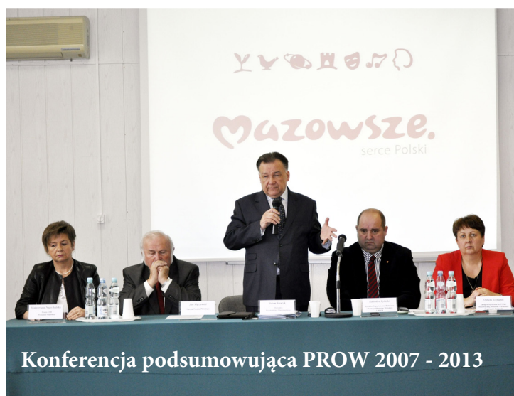
Konferencja podsumowująca PROW 2007 - 2013