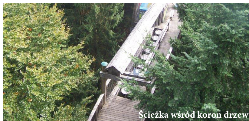
Ścieżka wśród koron drzew

Wyjazdy tego typu są dobrą okazją do wymiany poglądów i spostrzeżeń, a także przeniesienia doświadczeń na nasz grunt”.