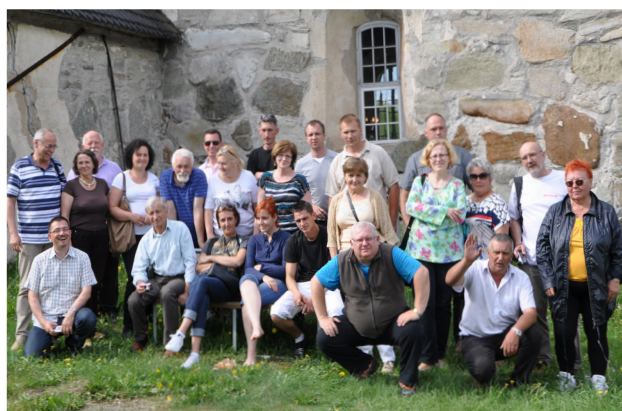
Finlandia - wizyta studyjna przedstawicieli firm turystycznych - czerwiec 2013 r.