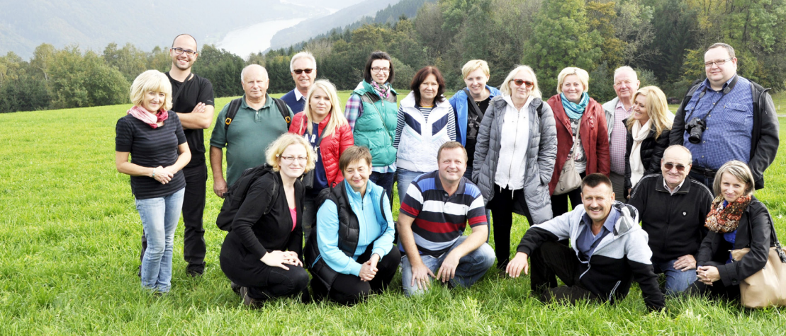
Uczestnicy wizyty studyjnej do Austrii