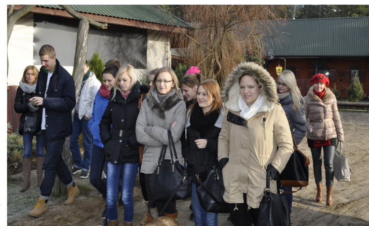
Spotkania z młodzieżą - grudzień 2013 r.

Miał na celu podsumowanie i przedstawienie