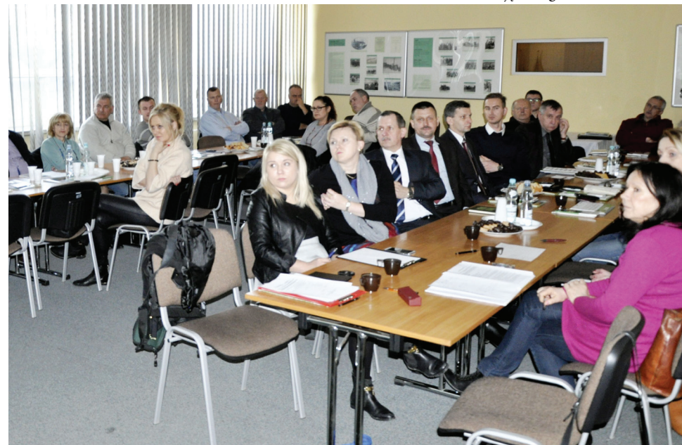
Spotkanie 16.02.2015 r.