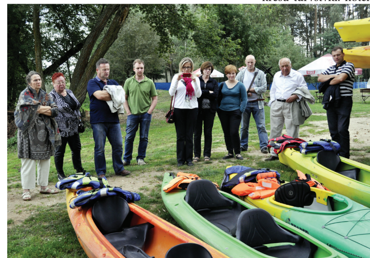
Wizyta studyjna 19.09.2014 r. Sobieski

„Europejski Fundusz Rolny na rzecz Rozwoju Obszarów Wiejskich: Europa inwestująca w obszary wiejskie.” Publikacja współfinansowana ze środków Unii Europejskiej w ramach osi 4 – LEADER Programu Rozwoju Obszarów Wiejskich na lata 2007-2013. Międzynarodowy projekt współpracy z akcją TERRA: „Tourism for Economic Revival of Rural Areas” / Turystyka – dla ożywienia gospodarczego obszarów wiejskich” realizowany jest w ramach działania 4.21 – „wdrażanie projektów współpracy”