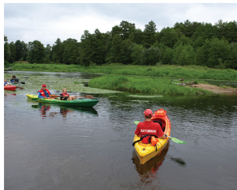
Spływ kajakowy rzeką Wkrą

Pólka-Raciąż: Wyprawa tramwajem konnym śladami Krzyżaków, questing historyczny, spływ kajakowy. Sochocin: zwiedzanie Izby Guzika.