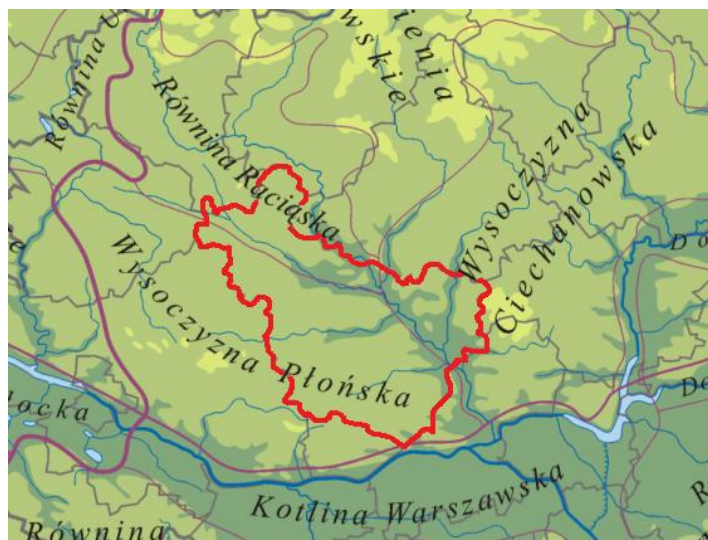
Ryc.2. Obszar LGD na tle mapy hipsometrycznej z mezoregionami wg J. Kondrackiego