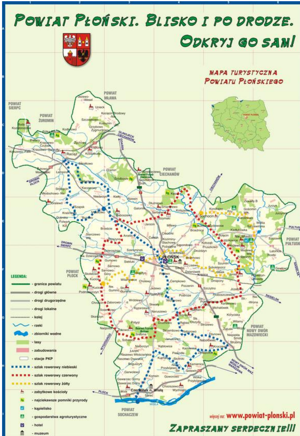
Ryc. 3. Mapa turystyczna powiatu płońskiego.