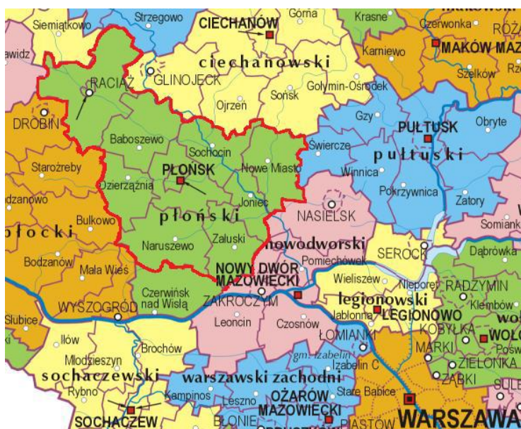
Ryc. 1. Obszar LGD - Przyjazne Mazowsze w układzie administracyjnym